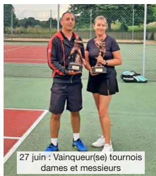
27 juin : Vainqueur(se) tournois dames et messieurs