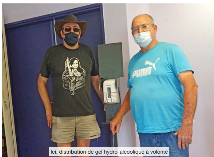
Ici, distribution de gel hydro-alcoolique à volonté