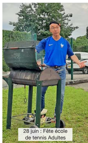
28 juin : Fête école de tennis Adultes