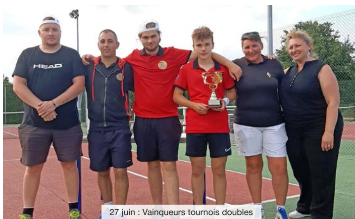
27 juin : Vainqueurs tournois doubles