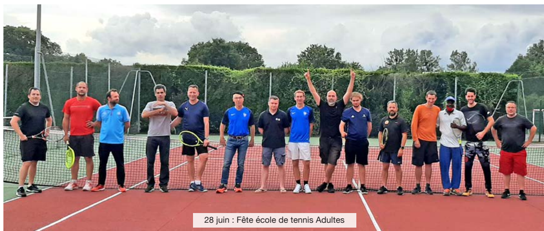
28 juin : Fête école de tennis Adultes