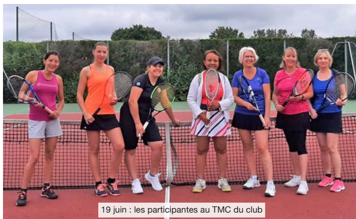
19 juin : les participantes au TMC du club