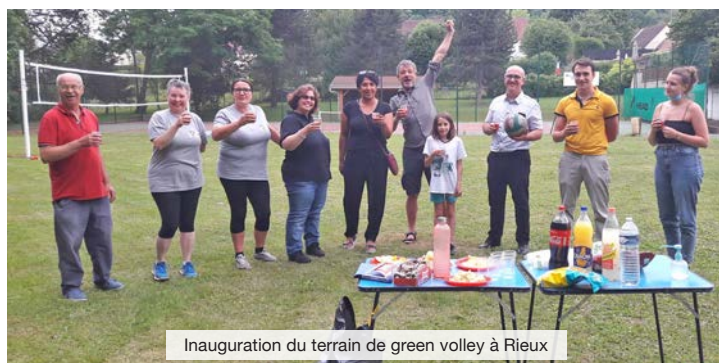
Inauguration du terrain de green volley à Rieux

Alors si vous avez envie d'essayer le volley-ball, « en volley-vous avec le RVB » et nous vous attendons début septembre 2021