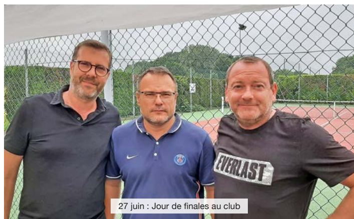
27 juin : Jour de finales au club