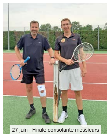
27 juin : Finale consolante messieurs