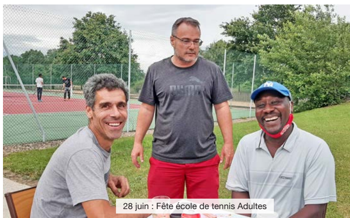
28 juin : Fête école de tennis Adultes