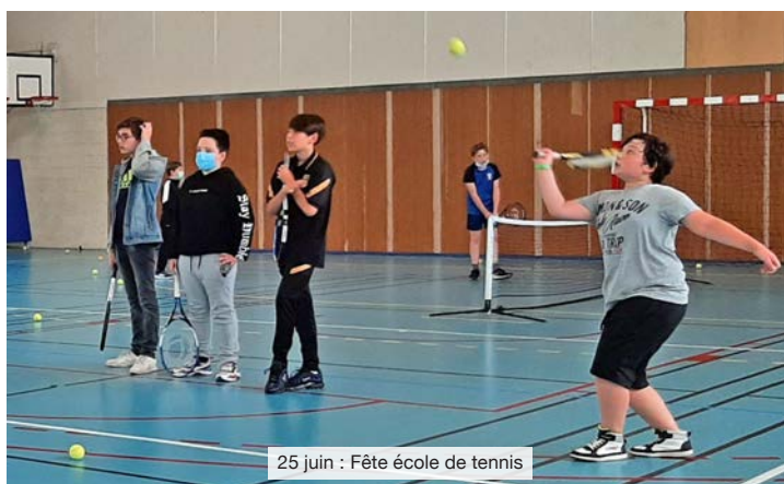
25 juin : Fête école de tennis