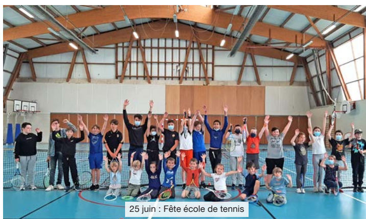
25 juin : Fête école de tennis