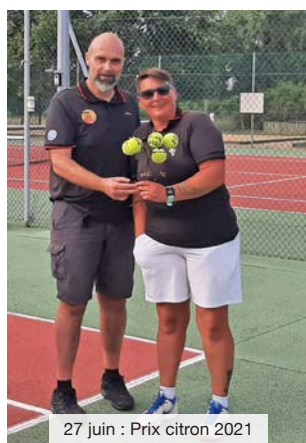
27 juin : Prix citron 2021