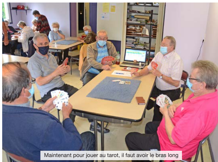
Maintenant pour jouer au tarot, il faut avoir le bras long

Enfin, le Fil d'Argent espère maintenir sa sortie-croisière du 10 septembre sur les bords de la Marne ainsi qu'un rendez-vous autour d'un repas pour commémorer les 20 ans de l'Association au cours du 4 ème trimestre.