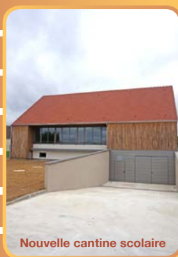
Nouvelle cantine scolaire