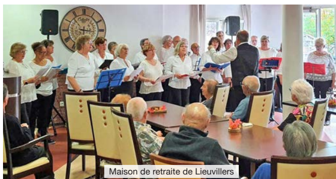
Maison de retraite de Lieuvillers

Le samedi 2 décembre les deux ateliers se sont déplacés à Moisselles (95) pour interpréter des chants de Noël dans l'église.