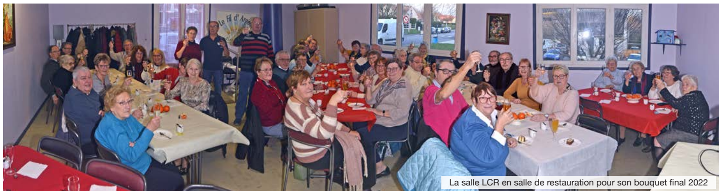
La salle LCR en salle de restauration pour son bouquet final 2022

On peut dire que le Fil d'Argent a fini l'année 2022 à la vitesse grand V, flashés en photos souvenirs. Le C-19 encore en retenue s'est abstenu de faire barrage aux adhérents qui sont tous passés par la herse de la vaccination.