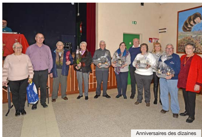
Anniversaires des dizaines