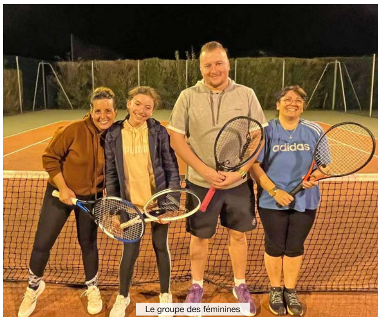
Le groupe des féminines