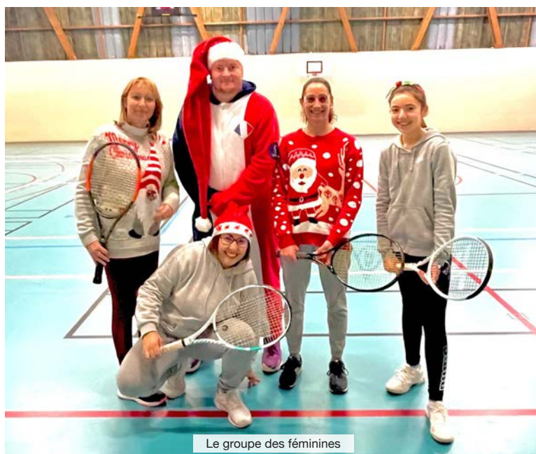
Le groupe des féminines

C'est désormais une habitude, les veilles de vacances scolaires, les séances de l'école de tennis se transforment en carnaval tennistique. Ce 17 novembre dernier c'est évidemment sur le thème de Noël que les cours se sont tenus.