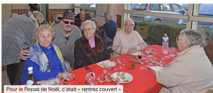
Pour le Repas de Noël, c'était « rentrez couvert »

A été remis à chaque convive un ticket de tombola permettant de gagner un présent.