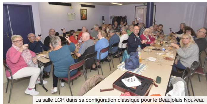
La salle LCR dans sa configuration classique pour le Beaujolais Nouveau

Ce 13 décembre entrera dans l'histoire, le couscous qui devait se dérouler dans une ambiance méditerranéenne se transformera en couscous polaire. Finalement, le temps d'une journée pour le Fil d'Argent, c'était Noël en Laponie, au pays du Père Noël (4). Si c'est pas de l'originalité ça ?!