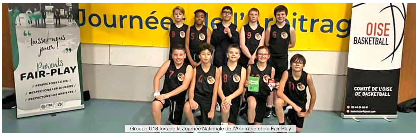
Groupe U13 lors de la Journée Nationale de l'Arbitrage et du Fair-Play