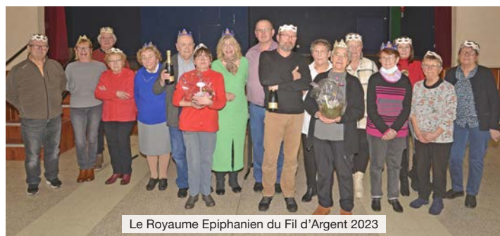
Le Royaume Epiphannien du Fil d'Argent 2023