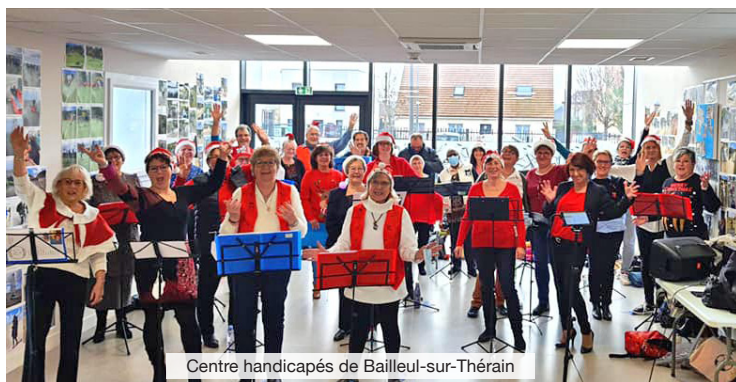
Centre handicapés de Bailleul-sur-Thérain