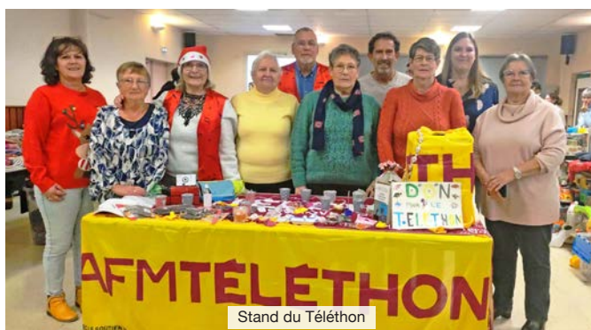
Stand du Téléthon