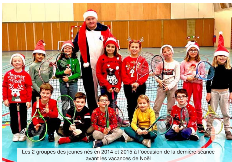
Les 2 groupes des jeunes nés en 2014 et 2015 à l'occasion de la dernière séance avant les vacances de Noël

Prochains rendez-vous pour nos équipes au mois de mars avec une équipe engagée en championnat messieurs 4e série. Une compétition réservée aux classements NC à 34. Une autre représentera le club dans la catégorie messieurs +45 ans. Enfin sur la même période 3 équipes jeunes tenteront de briller sur les courts dans les catégories garçons 13-14 ans et 17-18 ans ainsi que filles en 13-14 ans.