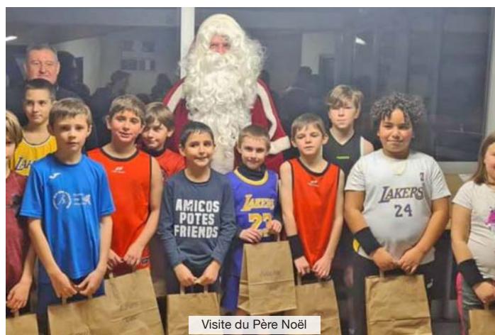
Visite du Père Noël