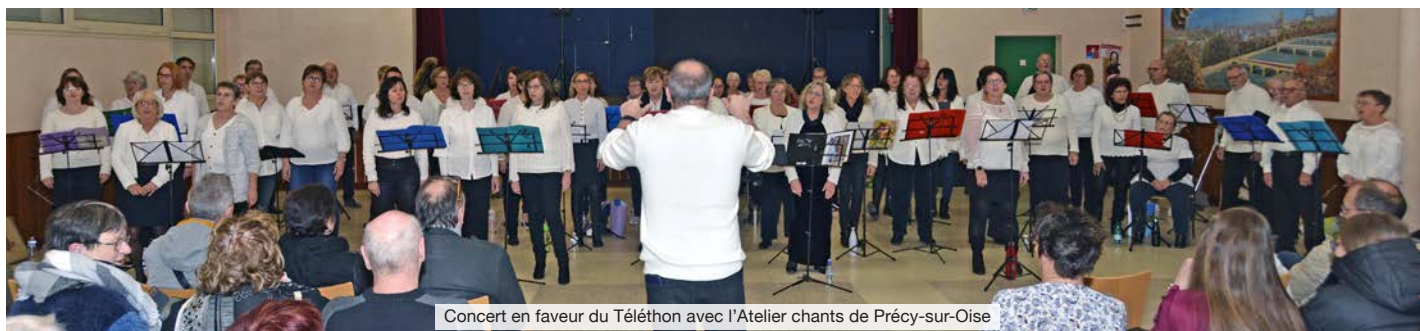
Concert en faveur du Téléthon avec l'Atelier chants de Précý-sur-Oise